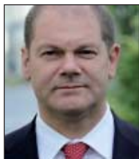
Olaf Scholz Stellvertretender Vorsitzender

Geboren am 14. Juni 1958 in Osnabrück, verheiratet, Rechtsanwalt