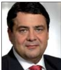
Sigmar Gabriel Parteivorsitzender

Geboren am 12. September 1959 in Goslar, eine Tochter, Lehrer in der beruflichen Erwachsenenbildung