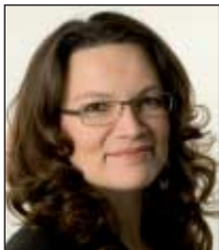
Andrea Nahles Generalsekretärin

Geboren am 20. Juni 1970 in Mendig, Wohnort: Weiler bei Mayen, Literaturwissenschaftlerin (MA)